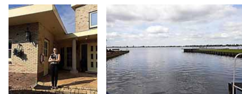
Woonkrant Petra Slaats 365 dagen te koop Vin-

Het is inderdaad veel, heel veel. En natuurlijk op een geweldige plek gelegen, pal aan de plassen. Waar-