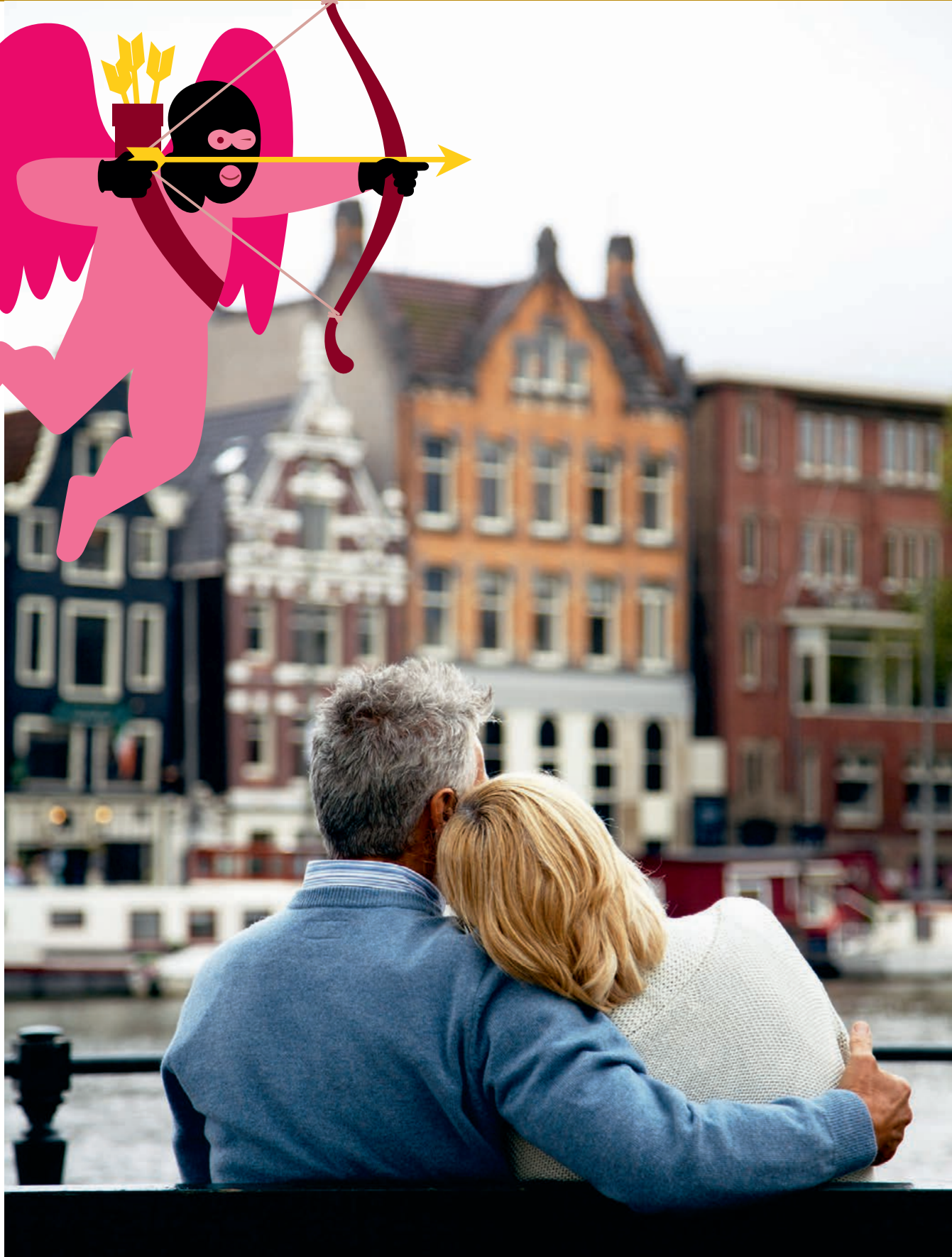
De mensen op de foto komen niet voor in het verhaal.